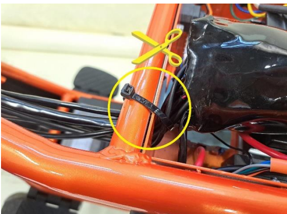
Katkaise johtosarjaa kannatteleva nippuside.