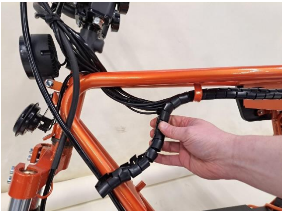
Irrota johtosarjan suoja.