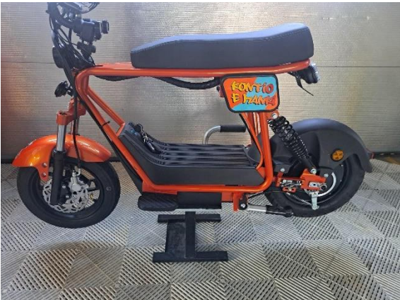
Nosta laite korokkeen päälle.