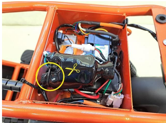
Katkaise johtosarja liittoksien suojaa kiinni pitävä nippuside (sivuleikkurit).