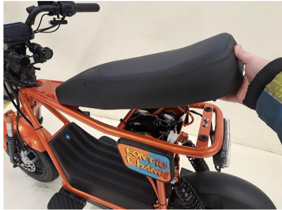
Ota istuin pois.